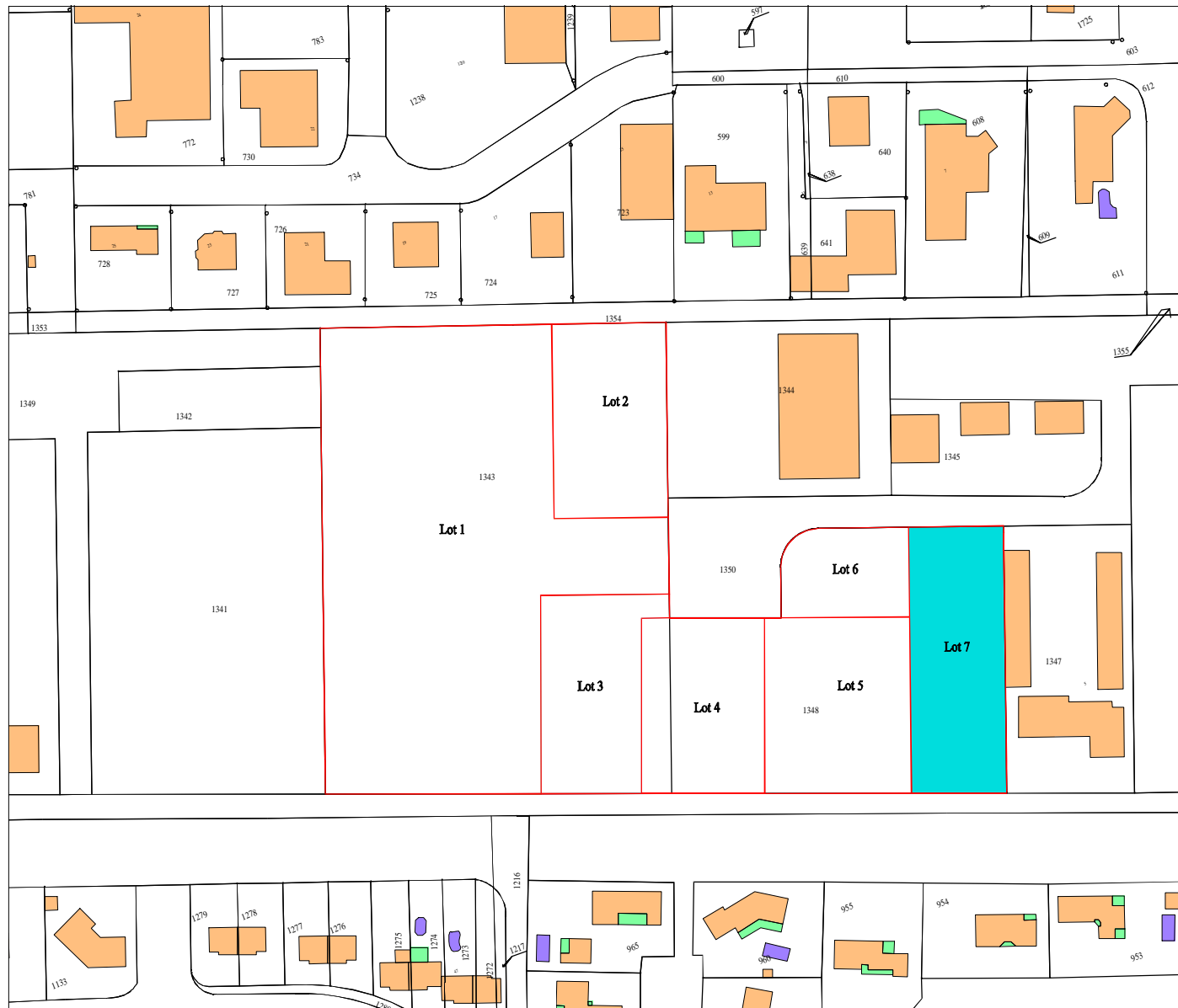
PLAN DE SITUATION Echelle : 1/2000

Dressé le 10/11/2021 par S.A.R.L. Julien PEREZ Géomètre-Expert Foncier D.P.L.G. 4 rue des papillons 32600 L'ISLE-JOURDAIN Tél : 05.62.07.03.76 Fax : 05.62.07.12.51 Mél : contact@geo32.fr