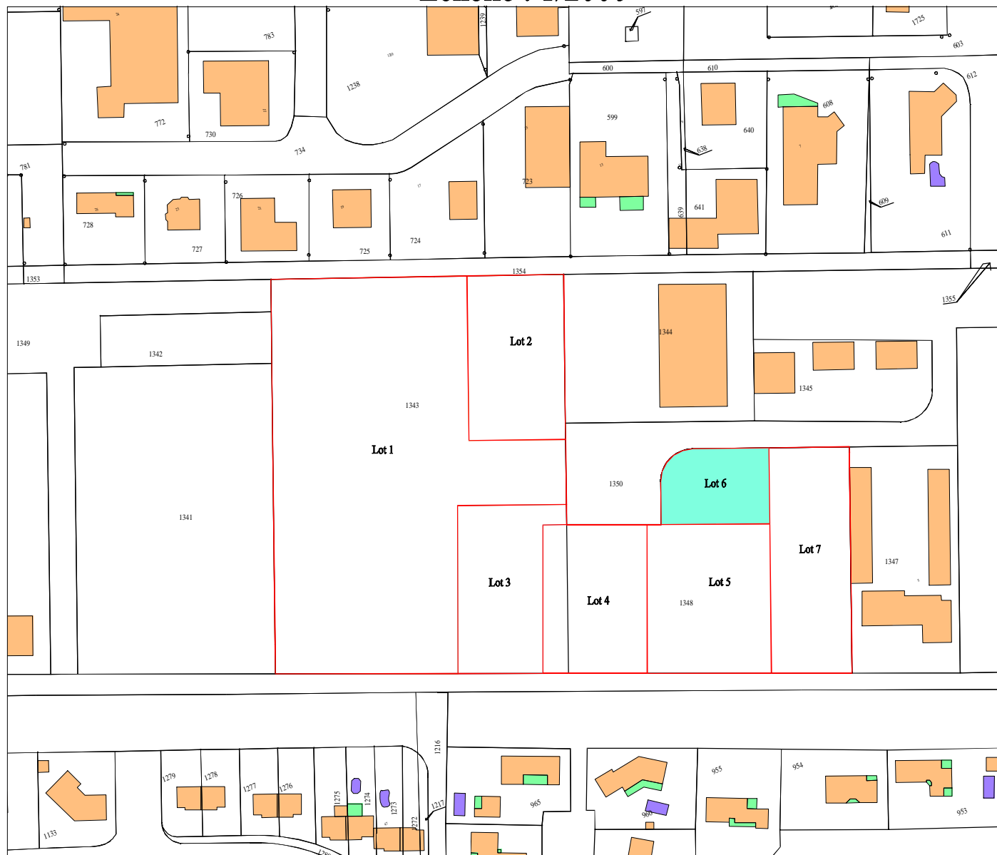
PLAN DE SITUATION Echelle : 1/2000

Dressé le 10/11/2021 par S.A.R.L. Julien PEREZ Géomètre-Expert Foncier D.P.L.G. 4 rue des papillons 32600 L'ISLE-JOURDAIN Tél : 05.62.07.03.76 Fax : 05.62.07.12.51 Mél : contact@geo32.fr