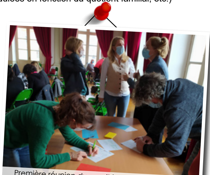
Première réunion du comité technique inclusion avec l'ensemble des partenaires.

Gascogne Toulousaine qui devient ainsi un territoire expérimental. La CAF du Gers finance une partie de ce nouveau poste dont les compétences vont au-delà de son champ d'actions habituel. Pour que les actions prennent en compte tous les habitants du territoire, y compris les plus isolés et/ou vulnérables, la CAF accompagnera au quotidien les chargés de coopération dans leurs démarches et la mise en place de nouvelles solutions en matière de mobilité et de transition écologique (besoins, tarifications modulées en fonction du quotient familial, etc.)