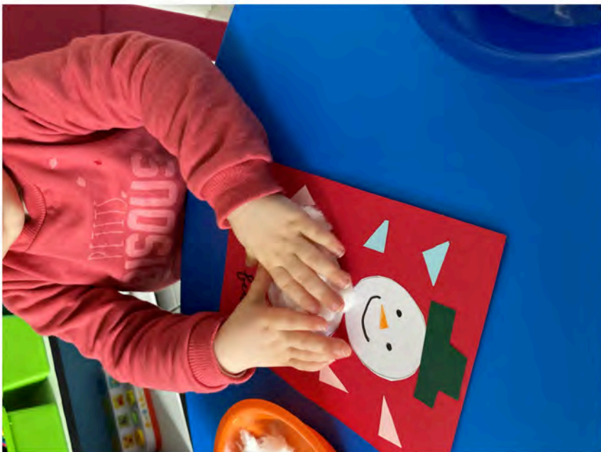
Le bonhomme de neige